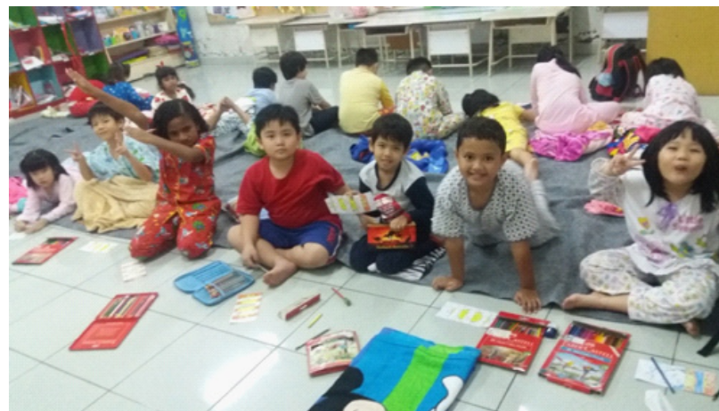
▲ Kegiatan mewarnai gambar

Beberapa kegiatan yang dilakukan saat Sekolah Sore, yaitu mengamati perbedaan sore dan malam serta menggambarkan benda yang bias diamati saat sore dan malam hari, ada kegiatan melihat film bersama teman, ada kegiatan tidur, membuat agamograf bulan dan matahari, ada kegiatan menyantap kudapan sore (bubur kacang hijau), ada waktu untuk bermain dan juga ada lomba melipat selimut, tentunya semua itu dilakukan untuk mendapatkan pengalaman yang berkesan bersama teman di