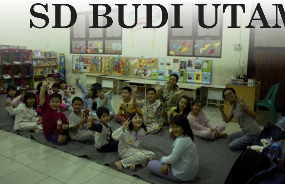
◀ Suasana kelas sore SD Budi Utama

sekolah, yang sesuai dengan tema yang sedang berjalan di kelas 1. Pembelajaran tersebut mendapat respon yang sangat baik dari para siswa kelas 1, mereka semua sangat antusias mengikuti kegiatan Sekolah Sore.